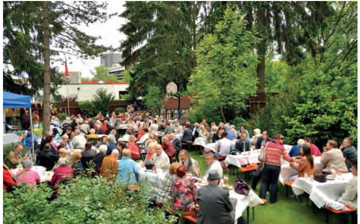
Mitglieder und Gäste am Tag der Offenen Tür in unserem Garten der Begegnung Am Oberen Marienbach

In Altenburg in Thüringen besuchte unser Reisekreis das Lindenau Museum im Schloßpark mit einer Führung im Schloss zur Ausstellung über Georg Spalatin, der im Jahr 1532 für evangelische Fürsten, die sich in Schweinfurt versammelt hatten, den ersten evangelischen Gottesdienst in der heutigen St. Salvatorkirche gehalten hatte. Bis Ende des Jahres kann die Spalatin-Ausstellung dort besucht werden. Wir erleben ein Konzert der „Comedian Harmonists“ auf der Luisenburg im Fichtelgebirge am 10. August. In den Ferien planen wir einen Kurs für Kinder und Mütter im Garten Am Oberen Marienbach über „Gesunde Ernährung – selbst zubereitet“. Jugendliche Ausländer kommen zu einem Malkurs in die Natur. Als Beitrag zu den Interkulturellen Wochen laden wir Familien ein in unseren Garten zu Spiel und Sport.